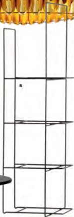
OPRAC. MARGA KAZIMIERCZYK, EK. ASP. ZDĄJCIE MICHAŁ MIODWIEG, SERWISY FRAJDERNE FIRMI