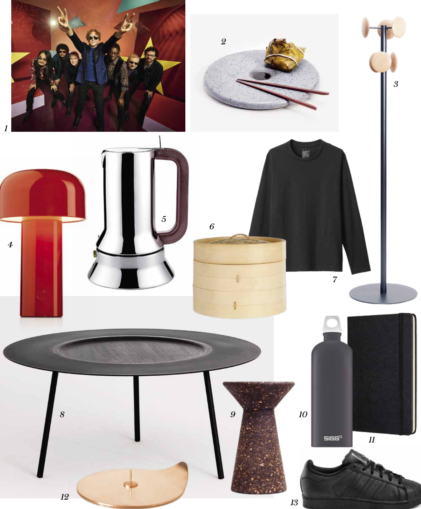
CHARAKTERYZACJA: AGNIESZKA JANCZYK.

A jeżeli już chcemy ofiarować rzecz, zadbajmy, by była dopasowana do osoby obdarowywanej, by trafiła w jej gusta, nie w nasze. Najważniejsze to zidentyfikować potrzebę i kupić to, co najlepiej na nią odpowiada. Jednym słowem wręczajmy bliskim w prezencie rzeczy faktycznie im potrzebne oraz wybierajmy je tak, by były najlepsze w swojej kategorii, dobre dla nas, ludzi, i dla planety. Święta to świetny moment na taką refleksję.